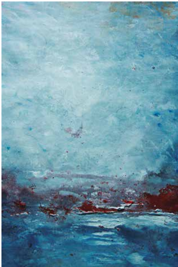
EN MEDIO DEL MAR Acrílico sobre tela • 95 x 120 cm